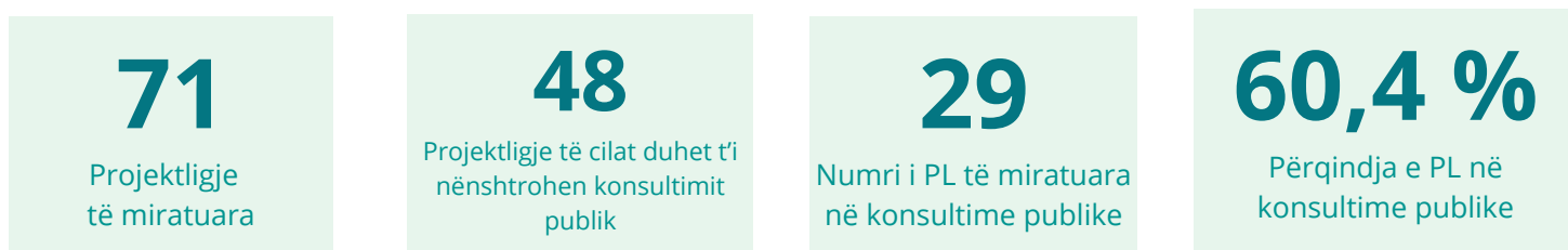
Treguesi nr. 6 - Numri i projektligjeve të miratuara dhe i atyre në Platformën e Konsultimeve Publike

Sipas informatave të qasshme në këtë platformë, rezulton se nga 71 projektligjet e miratuara në Qeveri, 48 prej tyre është dashur ti nënshtrohen procesit të konsultimit publik, derisa ky obligim nuk ka vlejtur në raport me 23 projektligje që kanë të bëjnë me ratifikimin e marrëveshjeve ndërkombëtare. Nga 48 projektligjet për të cilat Qeveria ka qenë e obliguar që të zhvillojë konsultime publike, Qeveria e ka përmbushur këtë detyrim në 29 raste, derisa këtë nuk e ka bërë në 19 raste. Shprehur në përqindje, Qeveria nuk e ka përmbushur këtë obligim në afërsisht 40% të rasteve.