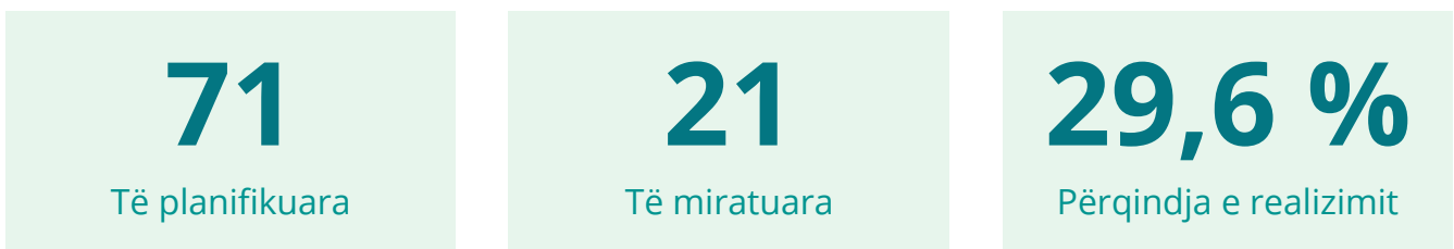
Treguesi nr. 1 - Efikasiteti i Qeverisë në miratimin e koncept dokumenteve

Sipas të dhënave zyrtare nga faqja e Zyrës së Kryeministrit deri në fund të vitit 2022, Qeveria e Kosovës ka miratuar gjithsej 21 koncept dokumente nga 71 sa kishte planifikuar. Shprehur në përqindje i bie se Qeveria ka përmbushur më pak se 30% të planifikimeve të saja në fushën e miratimit të koncept dokumenteve.