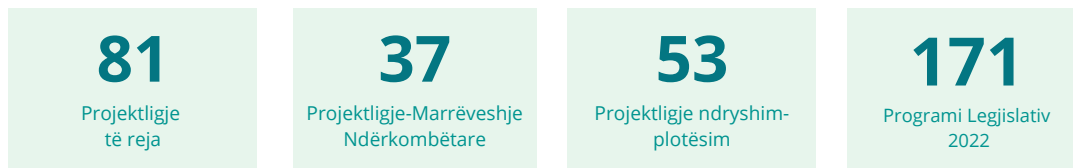
Treguesi nr. 3 - Lloji i projektligjeve në Programin Legjislativ për vitin 2022

Nga totali i 171 projektligjeve për t'u miratuar, del se 81 projektligje janë të reja, 37 projektligje janë marrëveshje ndërkombëtare dhe 53 projektligje janë ndryshim-plotësime.